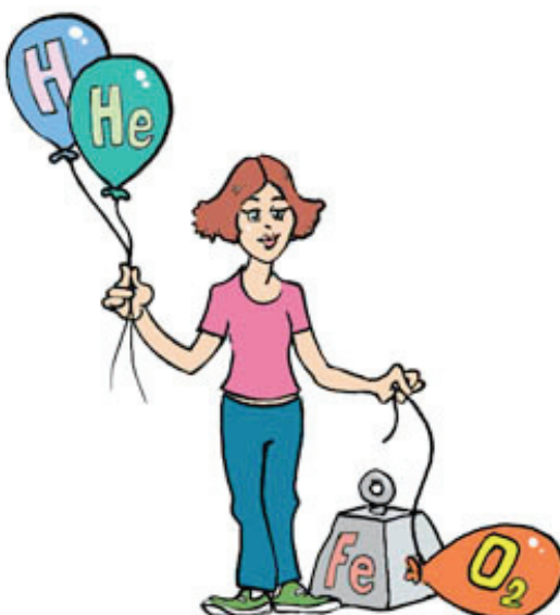
Obr. 1: Motivačný obrázok [4]