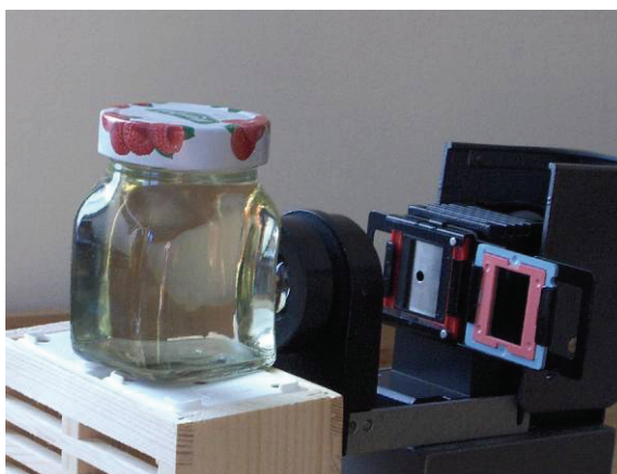
Obr. 5: Otáčanie roviny polarizovaného svetla

Ďalšou zaujímavou vlastnosťou, ktorú môžeme ukázať študentom je optická aktivita látok – schopnosť látky otáčať rovinu lineárne polarizovaného svetla. Do sklenenej nádoby s rovnými stenami si pripravíme koncentrovaný roztok sacharózy (obyčajného cukru). Nádobu s roztokom umiestnime pred diaprojektor a necháme ňou prechádzať lúč polarizovaného svetla (Obr.5). Roztok musí byť veľmi koncentrovaný, pretože optická otáčavosť sacharózy je pomerne nízka.