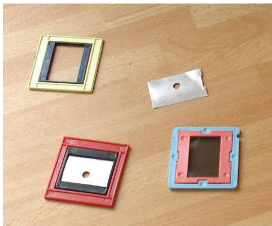
Obr.3: Príprava diarámikov s kruhovou hliníkovou clonou

Na základe teoretického výkladu objasníme pozorované javy, sformulujeme Brewsterov zákon a overíme ho tento krát už cieľným experimentom. Diarámik s polarizačným filtrom upravíme tak, že ho prekryjeme hliníkovou fóliou, v ktorej je perforátorom na spisy vystrihnutý kruhový otvor (Obr.3). Pripravíme si ďalší diarámik s rovnakou perforovanou Al fóliou, ale bez polarizačného filtra. Takto získame možnosť vytvoriť diaprojektorom úzky lúč obyčajného (nepolarizovaného) alebo polarizovaného svetla, pričom polarizáciu môžeme meniť zmenou orientácie zasunutého diarámika. Pripravíme si jednoduchý držiak na sklenenú platňu – my sme použili Petriho misku, ako držiak poslužil kus penového polystyrénu s vhodným výrezom (Obr. 4).