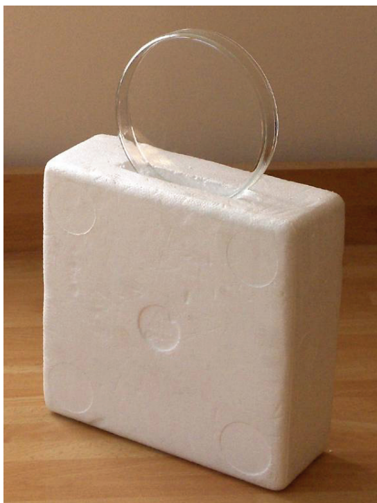
Obr.4: Sklenená platňa v otáčavom stojane