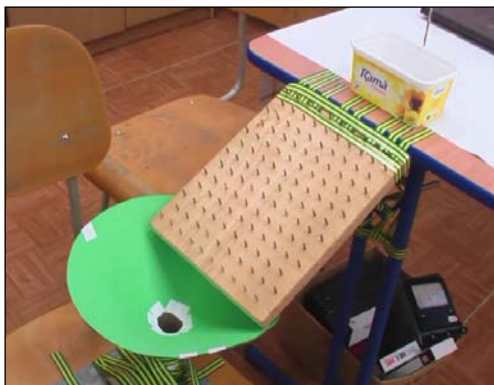
Obr. 1: Galton

Väčšina javov, ktoré sa objavili v RR zabezpečovali chod RR – ukončením jedného javu sa spustil ďalší. Objavili sa však aj javy, ktoré boli „len“ pre efekt a nezabezpečovali prenos energie na ďalší prvok reťaze (napr. uvoľnenie balóna).