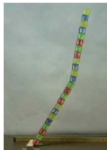
Obr.1a, b, c Padajúci komín. Tyčový model komína. Padajúca veža kociek, pevne spojených k základni.