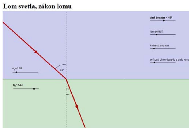
Obr. 2: Applet Lom svetla, zákon lomu

V applete sa dajú nastaviť tri počiatočné podmienky: index lomu prvého prostredia, index lomu druhého prostredia a uhol dopadu na rozhranie daných prostredí. Indexy lomu daných dvoch optických prostredí sme volili tak, aby ich rozsah pokrýval bežne používané hodnoty indexov lomu prostredí. Uhol dopadu sa dá spojiť meniť v intervale od 0° po 90°.